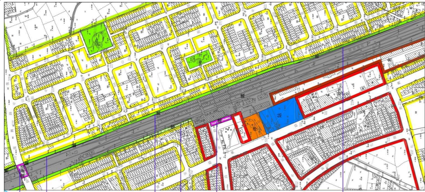
圖2 變更計畫示意圖